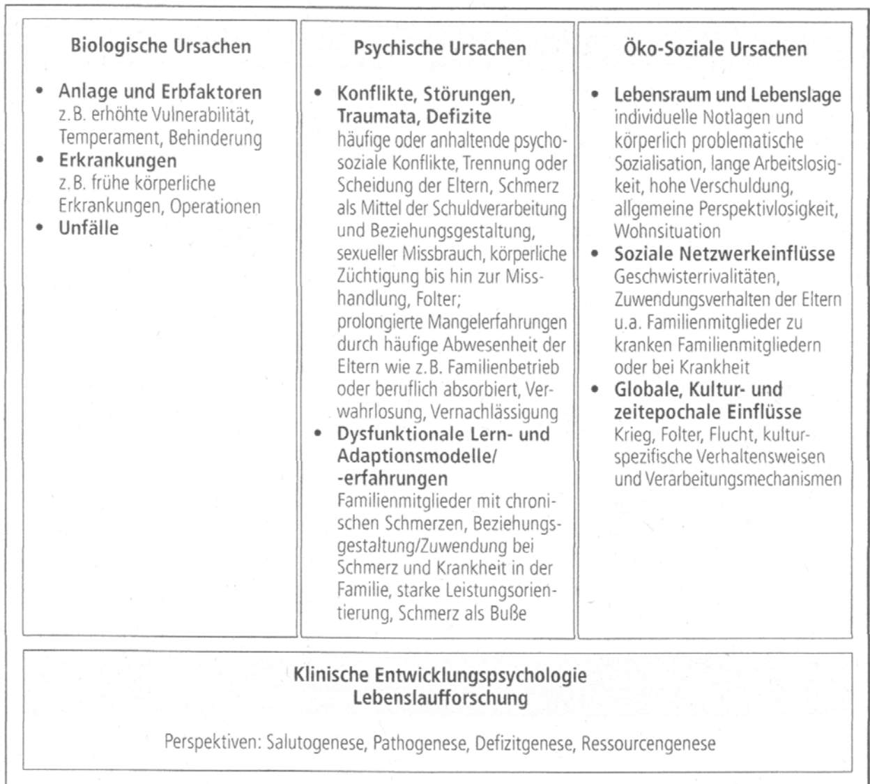
Abb. 2 Ätiopathogenetische Verursachung von chronischem Schmerz nach Bauder & Waibel 2009, S. 190

Wir müssen demnach bei den unterschiedlichsten Schmerz-Störungsbildern bei Patient*innen zunächst von einer erhöhten Vulnerabilität, einer ungünstigen Stressverarbeitung, frühkindlichen Belastungen und traumatischen Erfahrungen ausgehen. Hierbei gilt es beim therapeutischen Angebot darauf zu achten, gute Formen von Sicherheit, Halt, Struktur aber auch Möglichkeiten der Selbstregulierung und funktionalen Steuerung anzubieten.