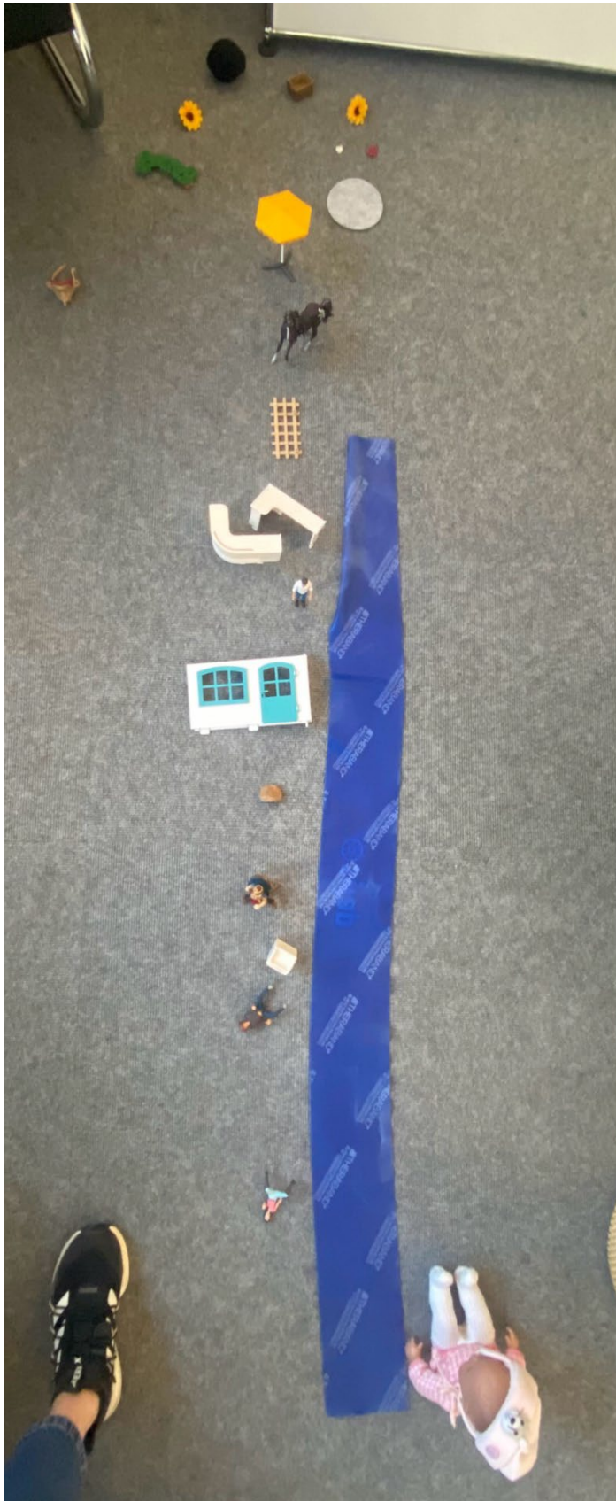
Abbildung 3: Willenspanorama Prozess 1 (25.02.26)