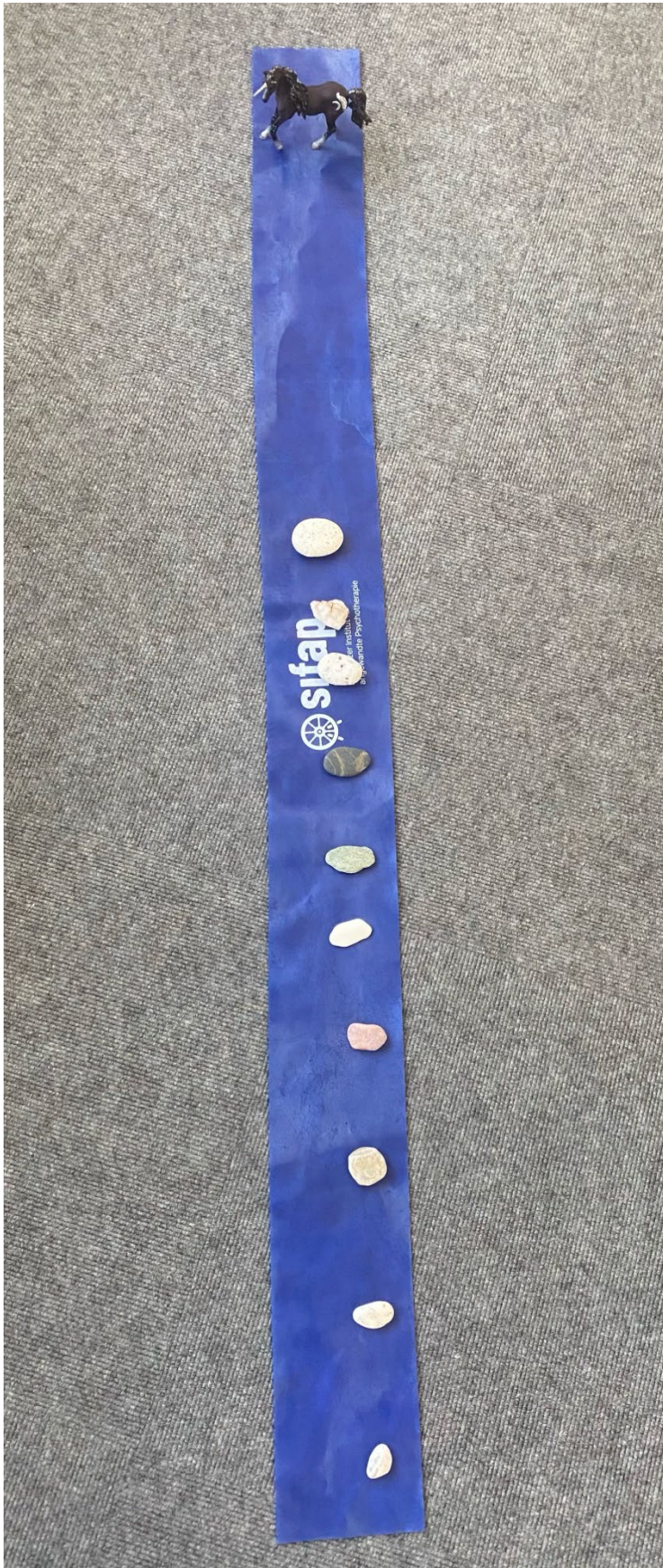
Abbildung 5: Willenspanorama Prozess 3 (03.03.26)